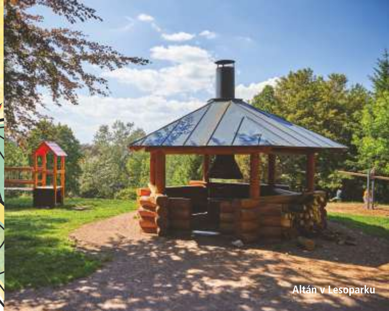
Altán v Lesoparku