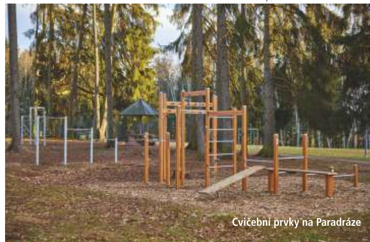
Cvičební prvky na Paradráze