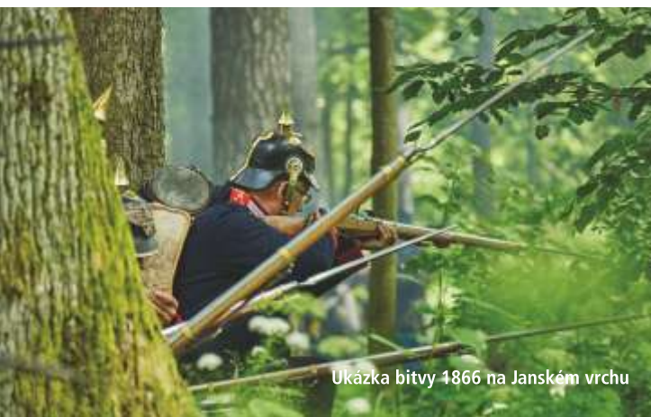
Ukázka bitvy 1866 na Janském vrchu