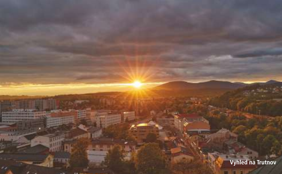
Výhled na Trutnov