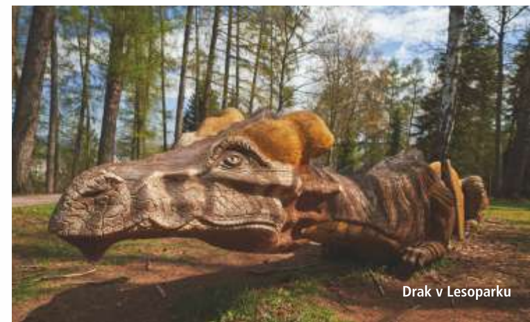
Drak v Lesoparku