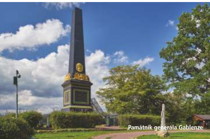
Památník generála Gablenze